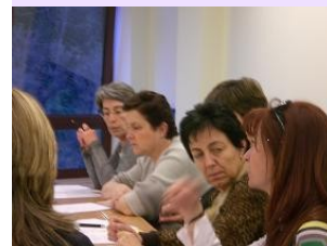
Reunió de Junta

27/12/10 La comunitat angloparlant de la Massana ens va fer una donació de 1500 euros. Diners que varen ser recaptats en la fira de Nadal i amb la venda de butlletes per la rifa. L'ADA, va col·laborar en la venda de butlletes.