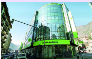
La Fundació Crèdit Andorrà subvenciona totes les acti- vitats del Grup Alba

Durant l'any 2010 el grup ALBA ha seguit organitzant diferents trobades amb les dones afectades de càncer de mama.