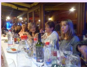
Sopar de Germanor de Nadal 2/12/10

El dia 2 de desembre amb motiu de les festes de Nadal varem organitzar el tradicional sopar de Nadal, on totes les assistents varem poder gaudir d'una vetllada de germanor.