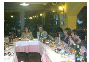
Sopar dia de la dona treballadora 04/03/10