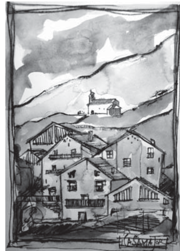
Il·lustració: Jordi Casamajor.

de la decadència d'aquesta casa amb el cor desbordat d'humanisme. I sap extraure del cas concret del laurèdia l'essència de la condició humana quan topa amb la desgràcia. La tristor que traspuja la citació que us proposo és excepcional i vol ser una manera dura i honesta de mirar-nos l'ànima al mirall per veure si encara som els que érem: gent senzilla.