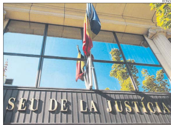
La seu de la justícia.

Una petició de dos anys de presó condicional i la prohibició d'entrar en contacte amb la víctima durant un període de cinc anys. Aquesta és la pena que va demanar ahir el ministeri fiscal per a un home acusat d'haver maltractat la dona. A més, la fiscalia l'acusa de vexacions, per la qual cosa sol·licita un mes d'arrest nocturn condicional, i d'haver maltractat també el gos, delicte pel qual demana 600 euros de multa. L'home va negar haver pegat la dona i va posar de manifest que les lesions que presentava es podrien deure al fet que durant la baralla entre la parella es van llançar objectes. És per això que la defensa demana que sigui absolt, tant dels maltractaments com de les vexacions, i va remarcar que els fets s'havien de situar en una baralla entre una