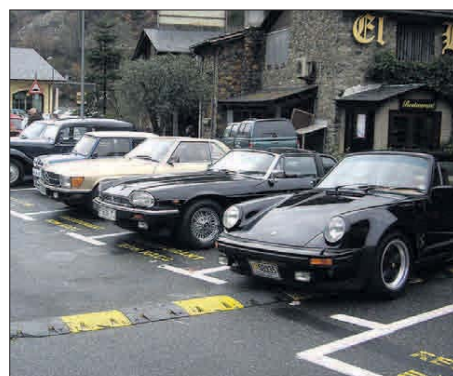
➔ Els vehicles tenen més de 25 anys d'antiguitat.

➔ La trobada de vehicles antics d'Andorra reuneix una vintena de participants