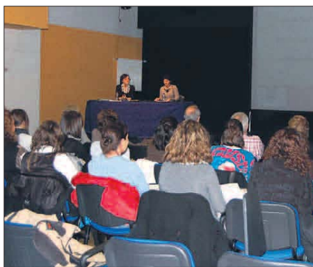
L'Aula Magna a la sala d'actes de La Llacuna.

La sala d'actes de La Llacuna va acollir ahir una sessió de l'Aula Magna, dedicada a les qüestions relacionades amb la salut. Va ser la primera de les dues classes destinades al tema i es va centrar en la nutrició i l'esport.